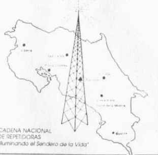
CADENA NACIONAL DE REPETIDORAS "Illuminando el Sendero de la Vida"